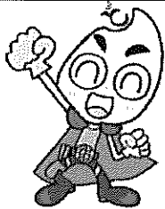
フードレンジャー・チャグリン ©伊東ちゆん子