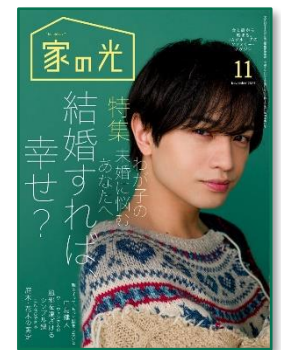
表紙 中島 健人 さん

人と人との摩擦って、相手としっかり向き合っていないから生まれるんじゃないかと思うんです。自分の思いを伝えようとする姿勢さえあれば……。だから、親だったらもっと子どもと話す機会を持つ。子どもは親に、夢や、やりたいことをもっと伝えていくべきではないか、と思います。