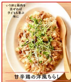
甘辛鶏の洋風ちらし

春のお祝い事や花見などの行事にぴったりの、さまざまな「ずし」を紹介します。 (P12~29)