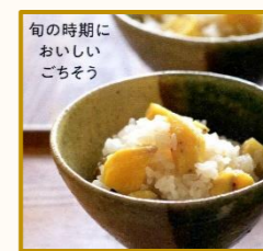
旬の時期に おいしい ごちそう