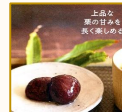
上品な 栗の甘みを 長く楽しめる

秋の到来を実感する“栗”。栗ご飯やおしゃれスイーツなど、レシピをたっぷり紹介。果実の栽培法や保存の仕方も案内します。(P67~76)