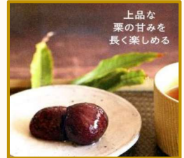
上品な 栗の甘みを 長く楽しめる

秋の到来を実感する“栗”。栗ご飯 やおしゃれスイーツなど、レシピを たっぷり紹介。果実の栽培法や保存 の仕方も案内します。(P67~76)