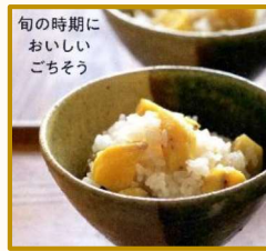
旬の時期に おいしい ごちそう