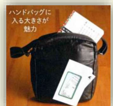
ハンドバッグに 入る大きさが 魅力