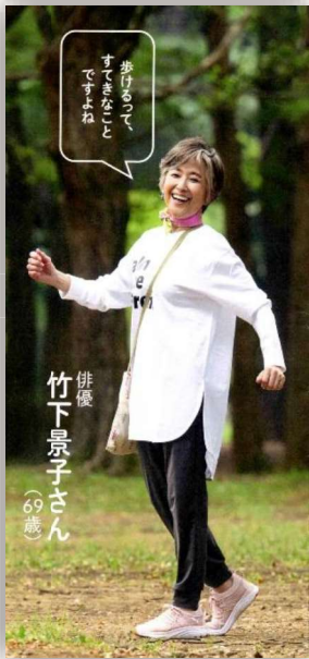
俳優 竹下景子さん (69歳)