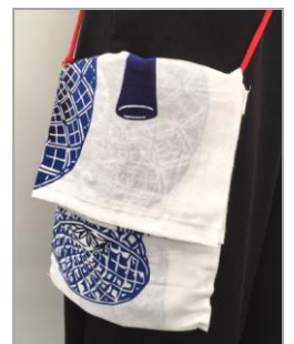
ふた付き ポケットポーチ (制作時間約 30分)

※JA家の光手芸教室開催のさいは『家の光』2019年9月号をテキストにしてください。 ※バッグの製作には、針や糸、安全ピン、ひもなどをご用意ください。