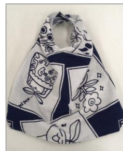
手提げ袋 (制作時間約 15分)