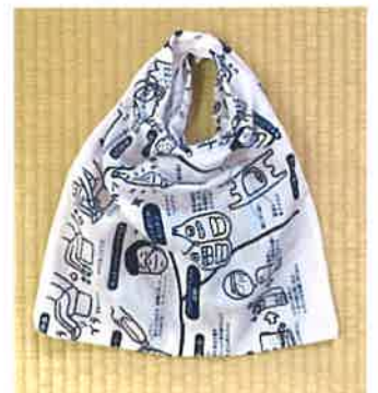
ふた付き ポケットポーチ