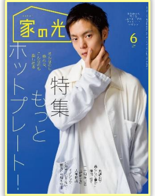
表紙 窪田 正孝さん

発酵食品を家で作るようになりまし た。「食」という字は「人を良くする」 と書きますよね。食生活が変わったこ とで、落ち着いて物事を考えられるよ うになりました。