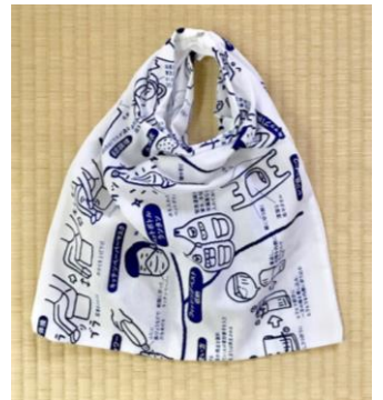
ふた付き ポケットポーチ